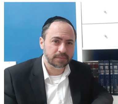
"האנשים המסוימים שיוצרים את הבלגן הזה – יש להם שמות, פנים, קטלוג חברתי". אייזיקוביץ

לרבנים, שחלקם לא משתפים פעולה עם ההנהגות, היה חלק בזה? פינקל: "לא. בן אדם חרדי לא מהרהר אחרי החלטות של רבנים. בציבור החרדי מאמינים שללימוד תורה של ילדים יש יכולת לשמור עלינו. ההוראה הגורפת של הרב חיים קנייבסקי לציבור הליטאי, שאני נמנית עמו, הייתה לסגור את תל- מודי התורה. אחר כך שמעתי שחלק מב- עלי מוסדות פנו אליו באופן פרטי והוא אמר להם שאם אפשר לפתוח תוך שמי- רת הנחיות, אז לעשות זאת כי זכות ליי- מוד תורה היא גדולה. מבחינתנו, חינוך ולימוד תורה הם החיים עצמם, בתפיסה שלנו, לעצור את לימוד התורה ולפגוע בחינוך של הילדים – מפחיד ויכול להיות מסוכן כמו המגיפה. לכן אם אפשר לדאוג שהילדים כן ישבו וילמדו, עם מסיכות,